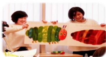
大型絵本の読み聞かせ