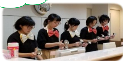
スタッフによるハンドベル演奏

多くの方からご好評頂き、 今年「第3回目」を予定しています。 皆さんが楽しんでいただけるような プログラムを用意しています。